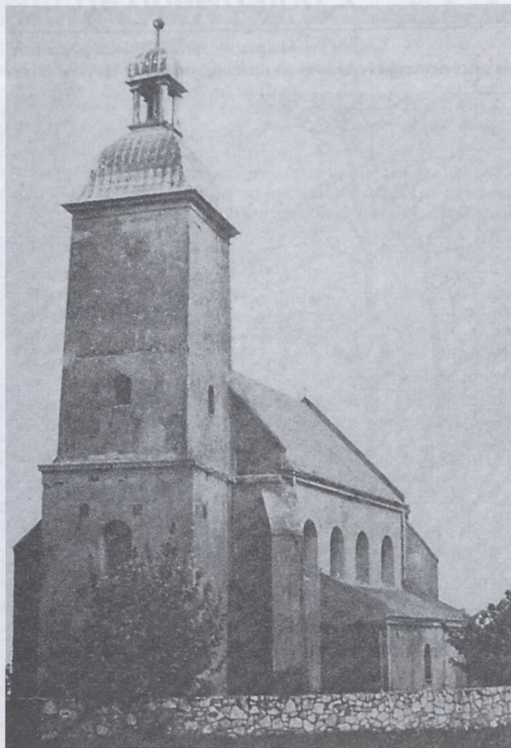
Barokowy kościół św. Doroty w Grojcu k. Będzina, fundowany przez ksienię Dorotę Kątską w 1637 roku

Jeszcze w roku 1599 zaczęła budować szpitalik ubogich przy klasztorze na Zwierzyńcu. Ubogimi opiekowali się członkowie Bractwa św. Anny, założonego także za jej panowania. Dbała także o