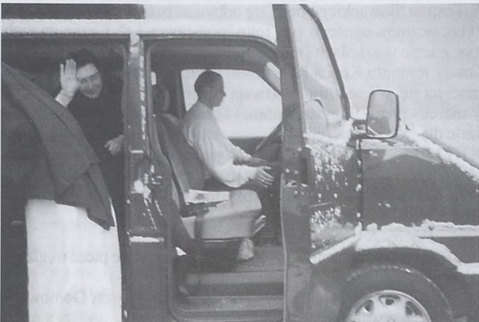
Odjazd z klasztoru na Zwierzyńcu 29 stycznia 1998 roku.

Czas milezenia ścisłego ustalono na godz. 14.00 - 15.00 i po modlitwie wieczornej do śniadania. Przy pracy można mówić tylko to, co konieczne.