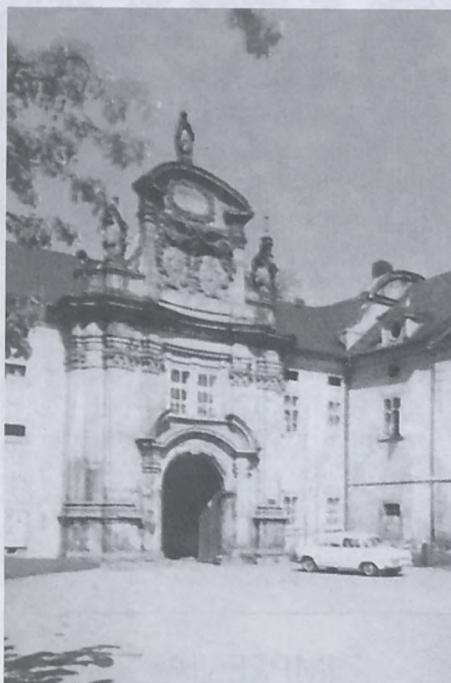
Brama wjazdowa na dziedziniec klasztoru w Doksanach.

W 1144 roku żona króla czeskiego Władysława II - Gertruda - rozpoczęła budowę żeńskiego klasztoru w Doksanach nad rzeką Ochrzą ok. 50 km. od Pragi. Wkrótce, poprzez Agnieszkę - siostrę Gertrudy i żonę naówczas księcia seniora Władysława II Wygnańca, Norbertanki zostały sprowadzone z Doksan do Krakowa - na Wzgórzu Najświętszego Salwatora, gdzie stał już niewielki kościółek. Tak rozpoczęła się historia klasztoru zwierzynieckiego - którego powstanie zawdzięczamy Doksanom.