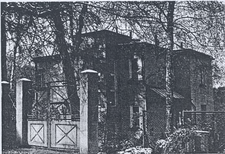
Dom przy ul. Spadzistej 23 (dzisiejsza Hofmana 32), w którym mieściło się biuro tajnego nauczania

Korzystając z osłony, jaką dawał mu Ostinstitut, mógł mój Dziadek w miarę bezpiecznie zorganizować tajne nauczanie uniwersyteckie. Tak więc uniwersytet podziemny działał w myśl konspiracyjnej zasady, że "najciemniej jest pod latarnią". W lokalu przy ul. Podwale 2 (po niemiecku Westring 47), którego okna wychodziły na komendę SS-manów i który był chroniony odpowiednim zaświadczeniem Ostinstitutu, powstała pierwsza kancelaria zakonspirowanej uczelni. Zawsze było tam pełno młodzieży, oczekującej na rozmowę z kierownikiem tajnego nauczania. Na studia przyjmowano na podstawie skierowań i poręczeń komórek szkolnictwa średniego lub ruchu oporu. Po zatwierdzeniu kandydata, kierowano go do odpowiedniej grupy czy wprost do innych profesorów. Tajne biuro uniwersyteckie zostało przeniesione później, jak już wspominałam, do domu pod Kopcem Kościuszki, gdzie 20-30 wizyt młodzieży dziennie było rzeczą zwyczajną. Ilość osób studiujących wynosiła bowiem około tysiąca, zaś liczba tajnych kompletów przekroczyła setkę.