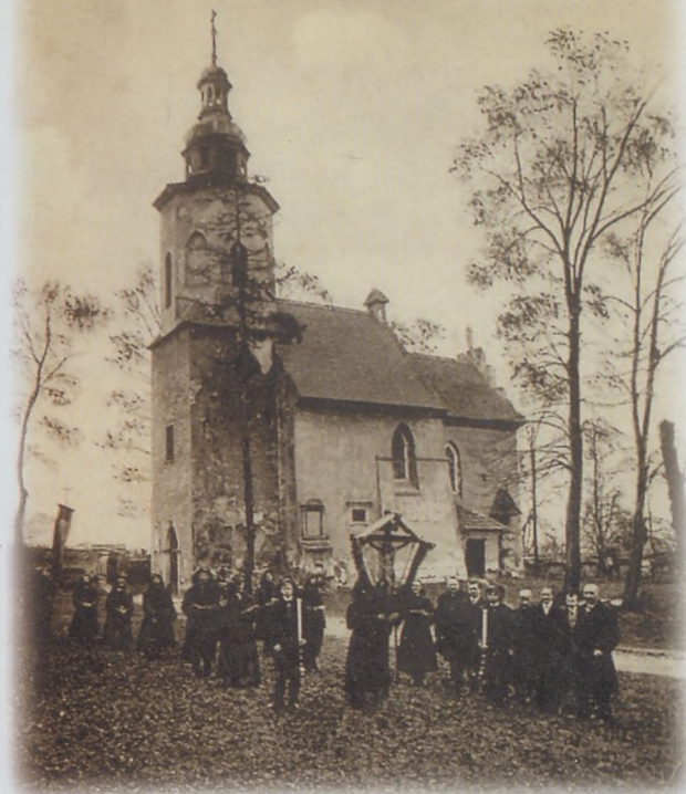
Bractwo Sw. Anny w okresie międzywojennym