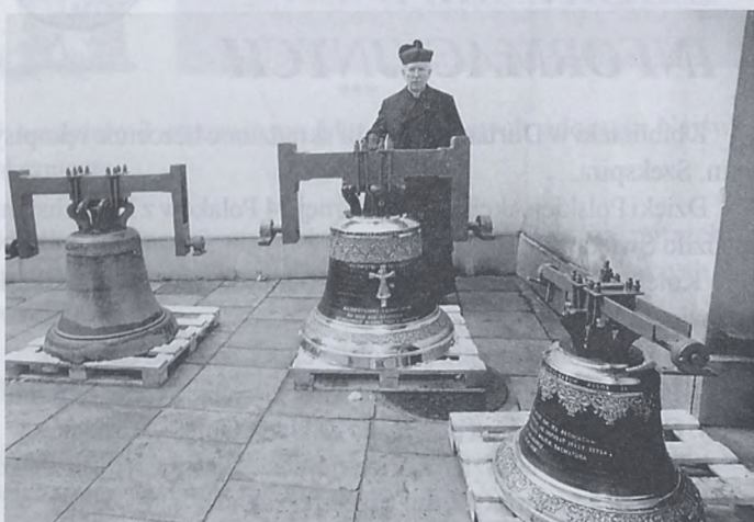
W 1998 roku zawisły nowe dzwony na wieży kościelnej