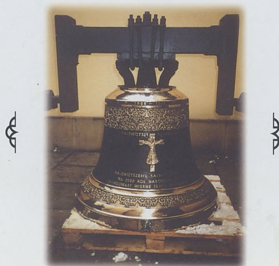
Jeden z dzwonów ufundowanych do naszego kościoła w 1998 roku