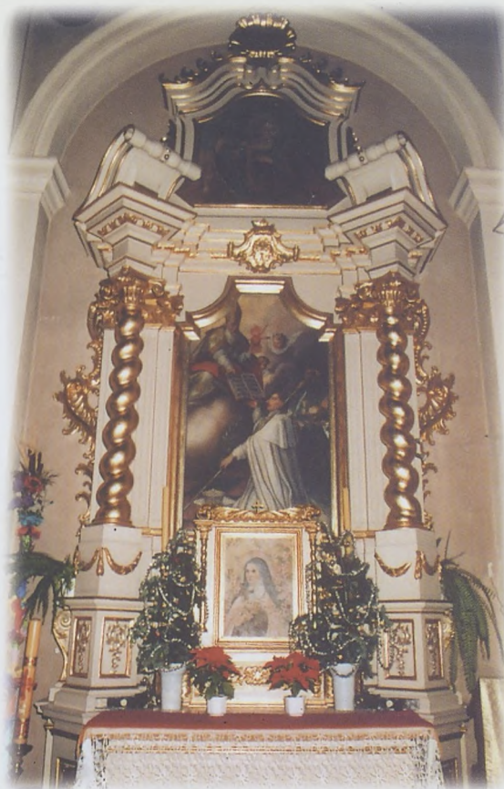
Ołtarz z obrazem przedstawiającym Św. Norberta odbierającego z rąk Św. Augustyna regułę zakonu premonstratenskiego