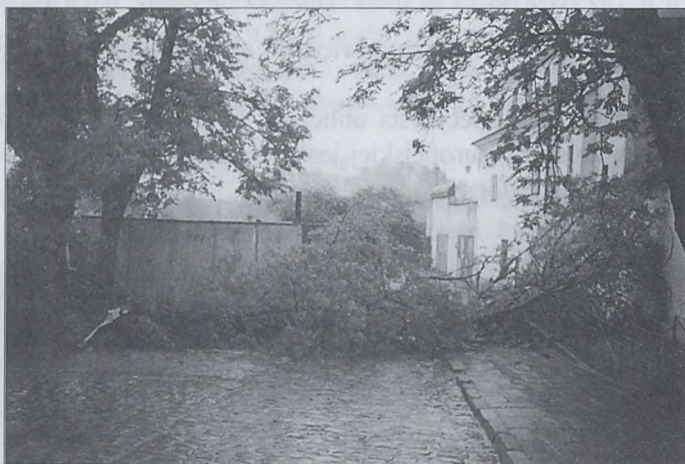
Kraków nawiedzały w tym roku wichury, nie szczędząc Salwatora.