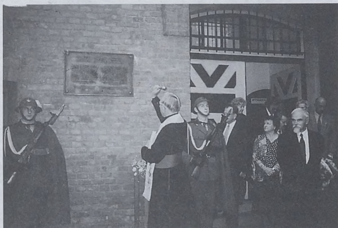
Pod Kopcem Kościuszki odsłonięto tablicę ku pamięci Naczelnika.