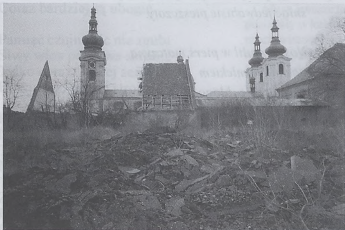
Klasztor w Doksanach. Na pierwszym planie widoczne ruiny, z których faktycznie klasztor jeszcze się dźwiga. Po lewej stronie wieża, podobna do zwierzynieckiej, po prawej kościół klasztorny.

17.45 "Pastorelle" w wyk. artystów "Sceny Eliot" 19.00 - Msza św. z wręczeniem daru ołtarza od Tygodnika Salwatorskiego