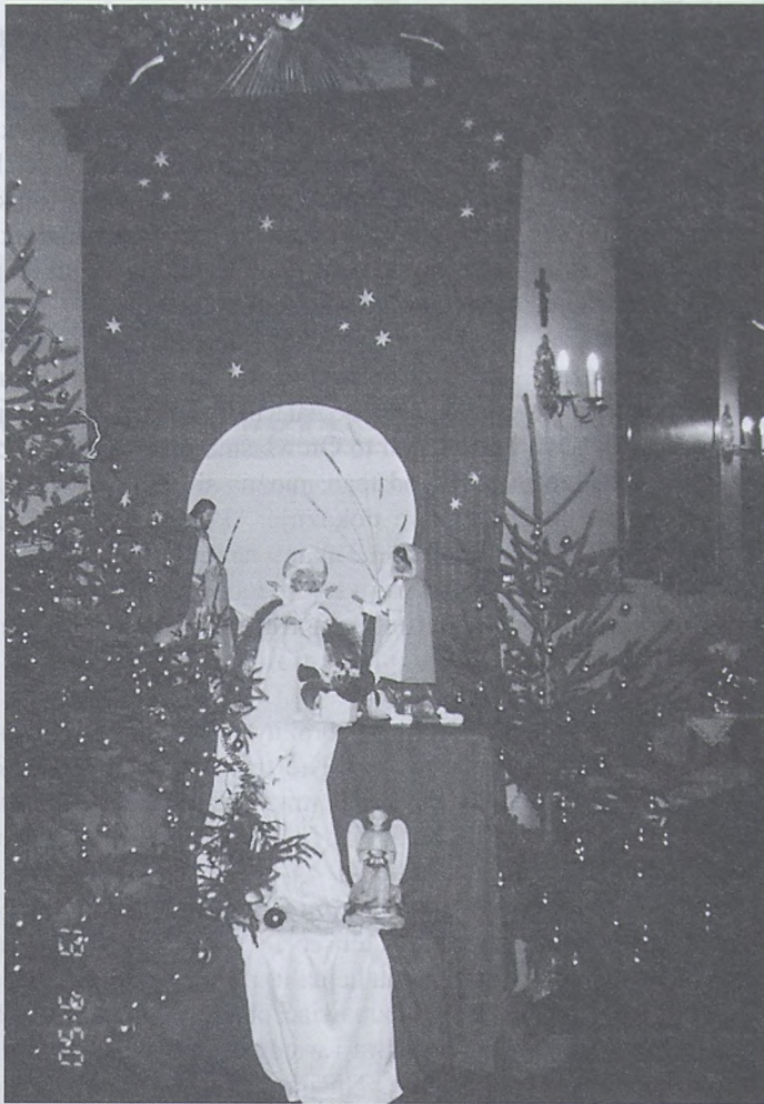
Ubiegłoroczna szopka z kościoła Bożego Miłosierdzia