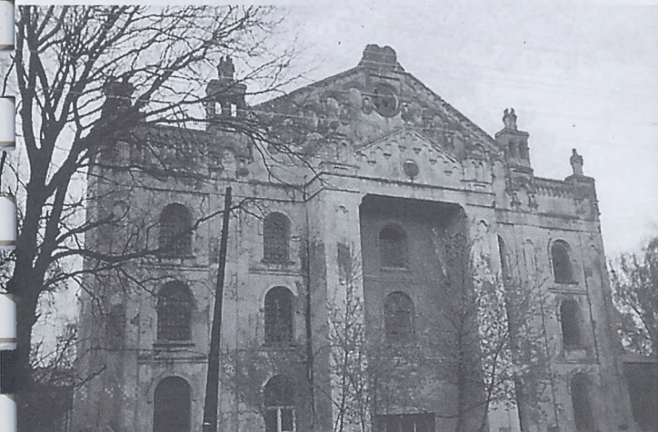
Synagoga w Drohobyczu

miejscowi Polacy czekają już na nas. Przyjęli nas bardzo gościnnie i serdecznie. Za nocleg i posiłek płacimy, jest to dla miejscowych ludzi okazja zarobienia nieco pieniędzy w trudnych czasach. Na Ukrainie wiele osób od całych miesięcy nie dostaje wcale pensji, zresztą i tak niskich jak na polskie standardy, albo też dostaje ich namiastkę w produktach wytwarzanych przez ich zakłady pracy. Potem usiłują je sprzedać na bazarach. Ceny zaś są zbliżone do polskich, albo czasami nieco wyższe. Zresztą nie ma co się dziwić, spora część towarów w tamtejszych sklepach pochodzi z Polski, Słowacji czy Węgier.