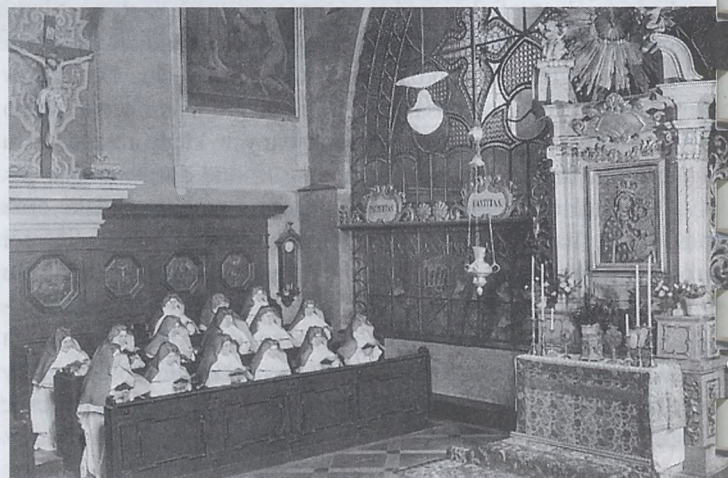
Siostry Norbertanki w czasie Liturgii Godzi