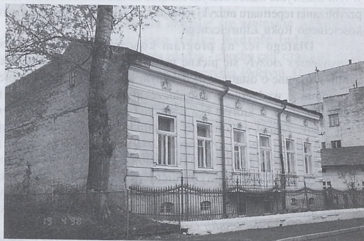
Dom Bruno Schulza

Druga wojna przetoczyła się przez miasto oszczędzając część zabudowy, ale niszcząc bezpowrotnie żydowski Drohobycz. Jego obraz utrwalony został na kartach powieści Brunona Schulza, autora "Sklepów cynamonowych", najsłynniejszego w świecie obywatela miasta. Niestety, do dziś nie zdobyło się ono na uczczenie jego pamięci.