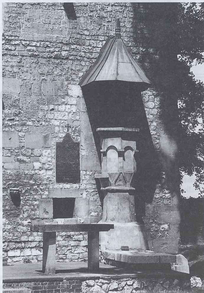
Tzw. kazalnica św. Wojciecha przy kościele Najśw. Salvatora