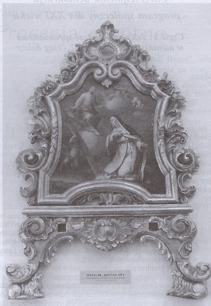
Feretron z XVIII wieku z bł. Bronisławą

w początkach tej epoki co w nazwie miała „ratio” a myśleć odczyła dla „rei vindicatio” stawiano gilotyny a potem wytworzono karabin maszynowy cyklon „b” i luizyt i bombę neutronową co niszczy tylko życie a zachowuje przedmioty