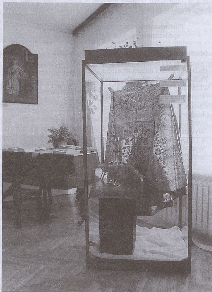
Norbertańskie paramenty liturgiczne

u schyłku tej epoki młodziutki troglodyta biega po mieście z pałką zabawką do grania w piłkę i zabija zabawką by zdobyć jakieś „res”