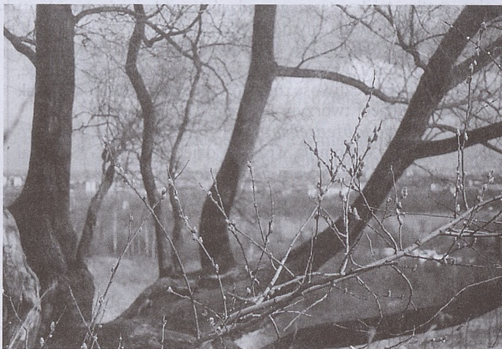
fol. P. Tumidajski