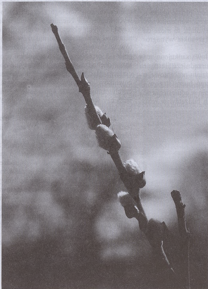
fol. P. Tumidajski