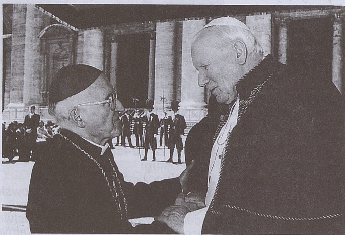
Spotkanie z Ojcem Św. na Placu św. Piotra

Używając fachowego słownictwa, Ksiądz Biskup przeniesiony został w stan spoczynku, ale wielu parafian, spotykając