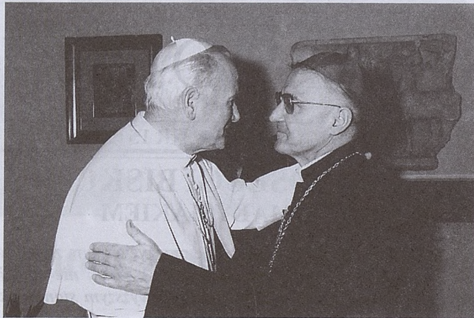
Na audiencji u Ojca Św.