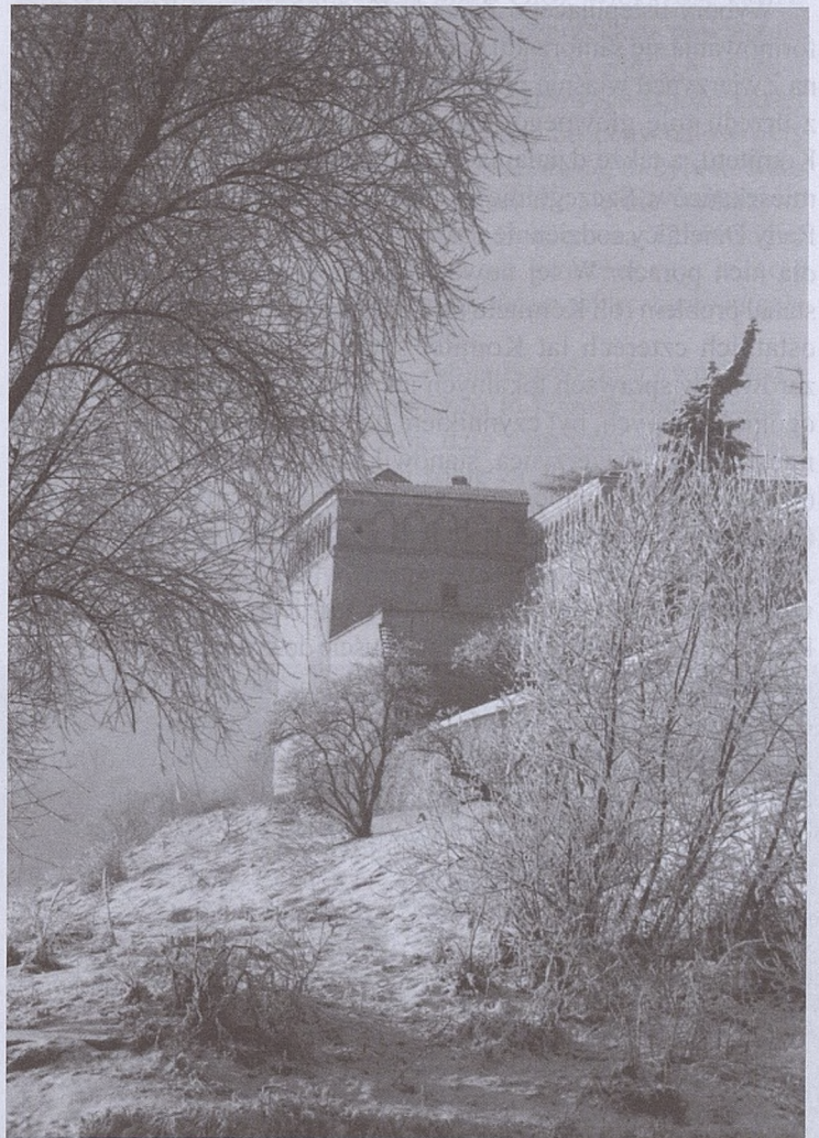
fol. P. Tumidajski

W Muzeum Historycznym Miasta Krakowa przy ul. Królowej Jadwigi 41 (tzw. Zwierzyniecki Salon Artystyczny) czynna będzie jeszcze do połowy stycznia wystawa poświęcona Konstantemu Krumłowskiemu i jego "Królowej Przedmieścia". Muzeum czynne jest codziennie (prócz poniedziałku i wtorku). Na zwiedzających czekają książeczki o Konstantym Krumłowskiem. Zapraszamy.