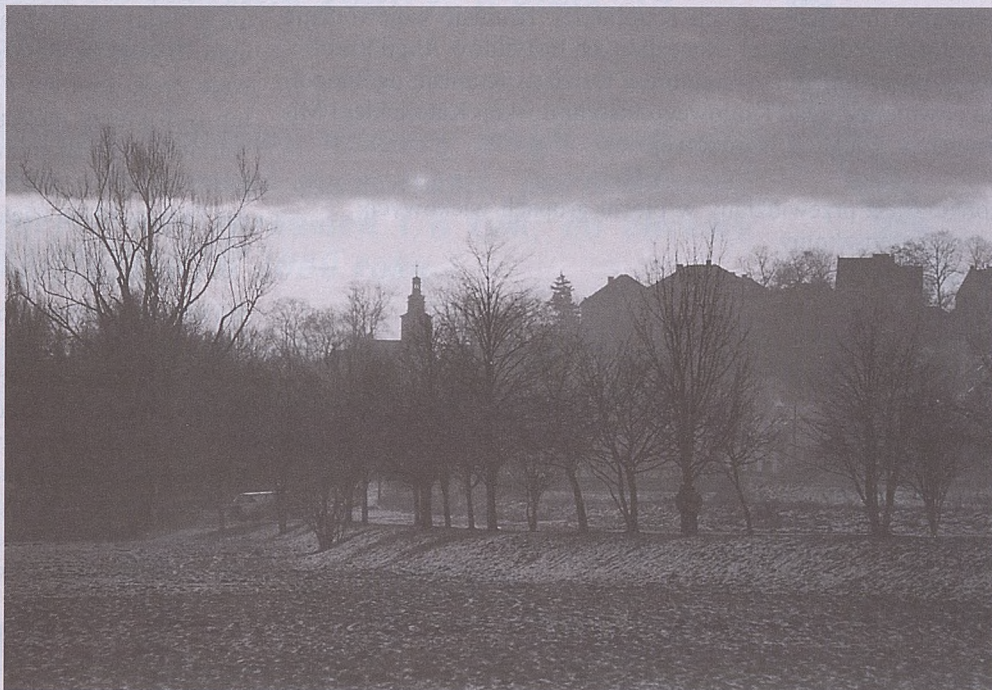
fol. P. Tumidajski