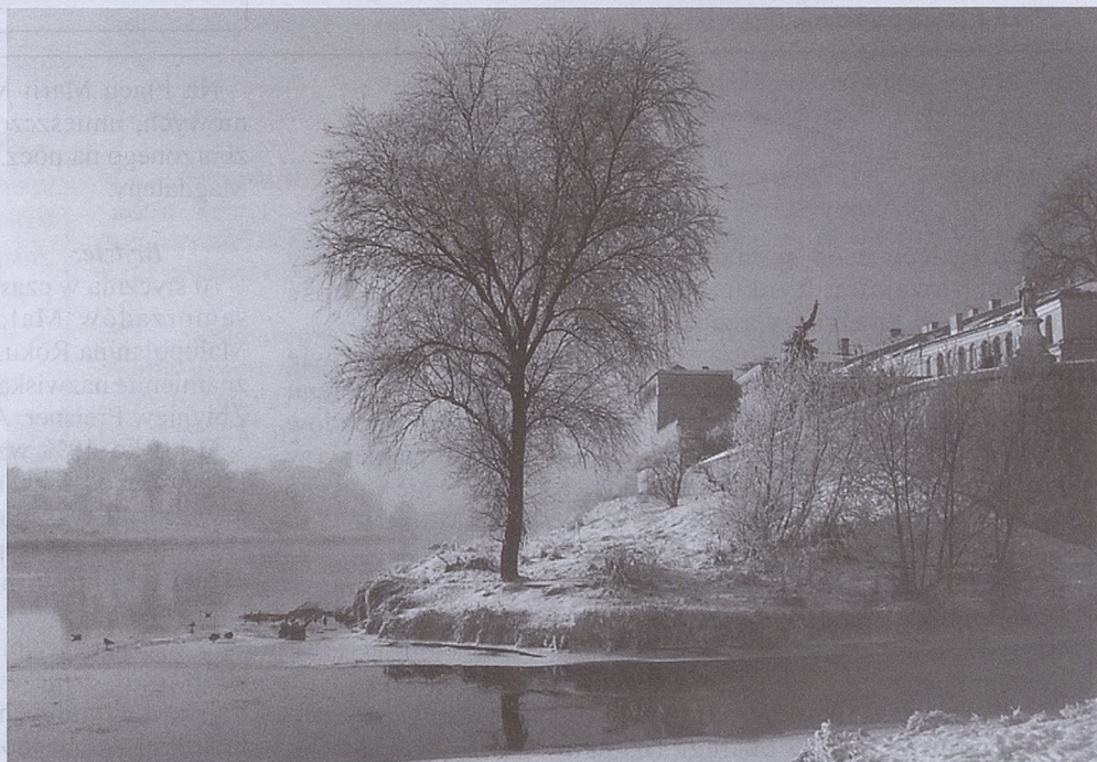
fol. F. Stalony-Dobrzański