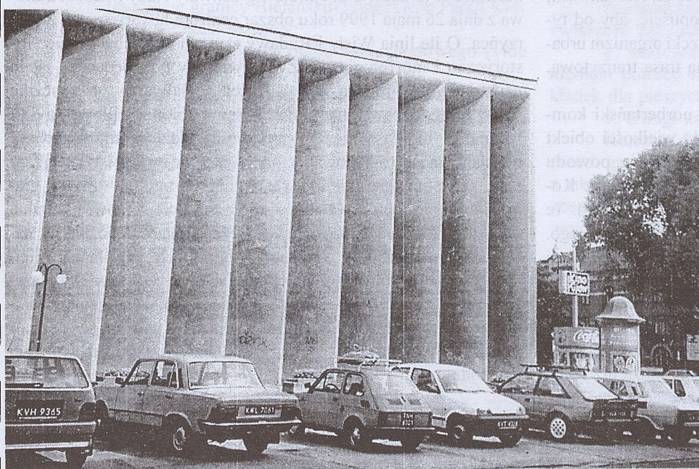
Ściana kina „Kijów” od strony ul. Dunin-Wąsowicza

Na moście Powstańców Śląskich zginęły trzy łabędzie. Możliwe że zostały spłoszone z Wisły i lecąc uderzyły w przewody trakcji elektrycznej.