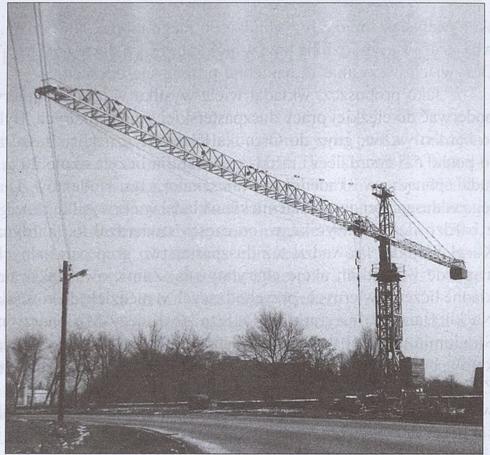
Trwają prace przy budowie mostu na Wiśle

~ Na frontowej ścianie teatru Bagatela umiejscowiony jest nowoczesny, wielkoformatowy elektroniczny nośnik reklamowy o pow. 20 metrów kwadratowych.