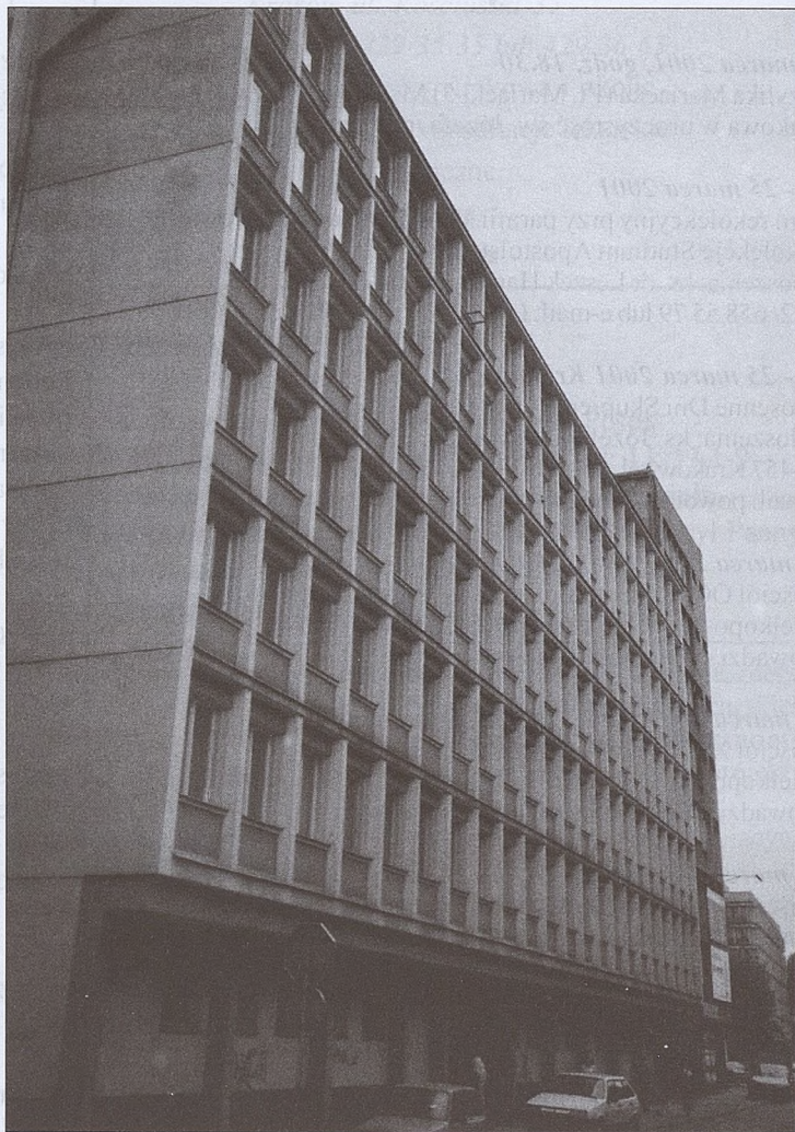
Budynek CHEMOBUDOWY przy ul. Stachowicza

TYGODNIK SALWATORSKI - Redakcja: Piotr Boroń (nacz.) tel. 422-68-92, e-mail: tygsal@polbox.com,