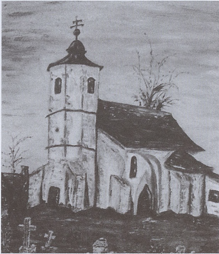
B. Erchegyi Ildiko, Kościół w Isaszeg, olej na płótnie

Polak - Węgier dwa bratanki! - to znane powiedzenie, często przytaczane przy okazji różnorodnych kontaktów przyjacielskich narodów. Rzeczywiście, nasze dzieje są świadectwem pokrewieństwa w doli i niedoli.