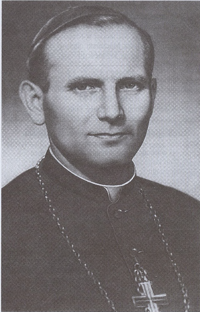
Ksiądz Karol Wojtyła jako Arcybiskup Metropolita Krakowski

ranny w brzuch i rękę został przewieziony do kliniki Gemelli i poddany parogodzinnej operacji. Szpital opuścił po 21 dniach pobytu, niemniej jednak komplikacje spowodowały, że na dobre powrócił do Watykanu w połowie sierpnia. Pomimo odniesionych ran i cierpienia papież-pielgrzym nie zaprzestał aktywnej działalności duszpasterskiej. Jan Paweł II podczas pobytu w Rzymie i sześciu pielgrzymek do ojczyzny kanonizował dziewięciu rodaków: św. Maksymiliana Kolbe 1982, św. Brata Alberta Chmielowskiego 1989, św. Rafała Kalinowskiego 1991, św. Jan Sarkandra 1995, św. Melchiora Grodzieckiego 1995, św. Jana z Dukli 1997, św. Jadwigę Królową 1997, św. Kingę 1999 i św. Faustynę Kowalską 2000.