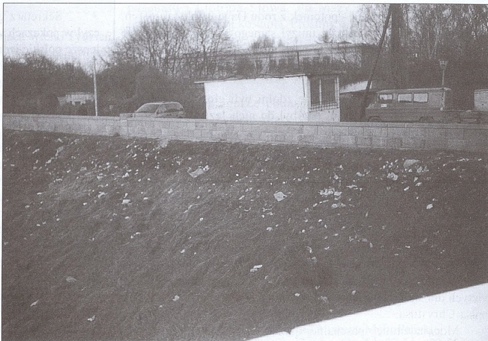
Śmietnik na brzegu Rudawy - luty 2001

Obecnie teren jest w zabudowie nowymi trójpiętrowymi blokami. Były na tej ulicy wille ukryte w pięknych ogrodach, były sady, łąki i pastwiska. Porykiwały krowy w przydomowych oborach, piali kogouty, ujadaly psy - to był najprawdziwszy Zwierzyńca. Co z niego pozostało? Pozostały stare chylące się domki, dotykające dachami ziemi. Pozostały wmuro-