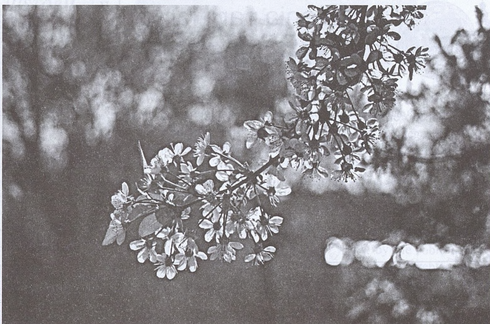
Kwitnąca wiśnia

Z wszystkich kontynentów ludzie pielgrzymują do Łagiewnik, jak do największych sanktuariów i mówią często: tu jest stolica Miłosierdzia Bożego.