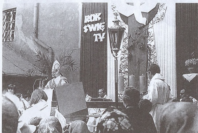
Fot. z odpustu emausowego z 1975 roku

22.04.01 r. • PISMO PARAFII NAJŚWIĘTSZEGO SALWATORA W KRAKOWIE • NR 16(331) • Rok 8