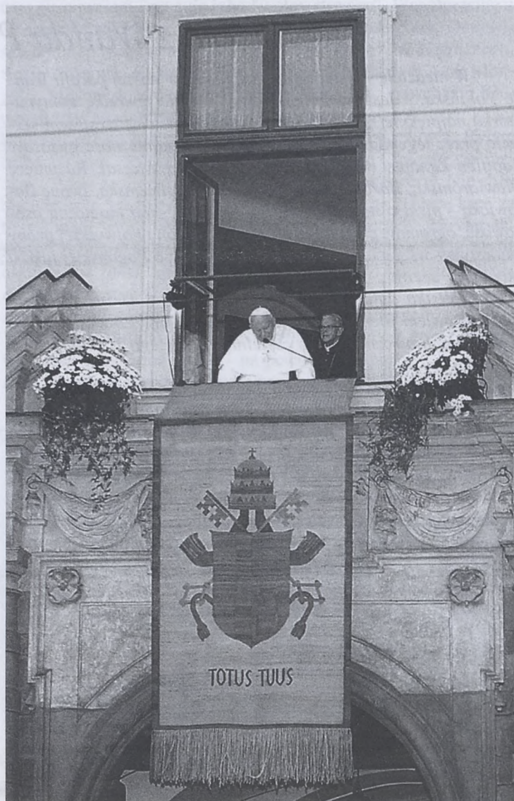
18 sierpnia 2002 - Jan Paweł II w oknie Kurii Krakowskiej

My mieliśmy się jeszcze spotkać o godz. 18.10. Zobaczyliśmy jeszcze z przewodnikiem „Rzym chrześcijański” i poszliśmy jeszcze raz na Plac Apostołów, żeby jeszcze raz zaśpiewać, żeby się pomodlić... I rzeczywiście. Zabłysło światło w oknie, potem zobaczyliśmy białą sylwetkę i usłyszeliśmy podziękowanie za przybycie, życzenia i błogosławieństwo dla nas, dla naszych rodzin i dla wszystkich rodaków.