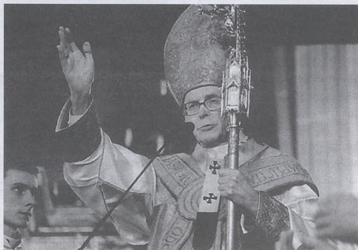
6 stycznia w Katedrze odbyła się uroczysta Msza św., inaugurująca 25. rok posługi kardynalskiej Metropolity Krakowskiego, fot. P. Tur., Jajski