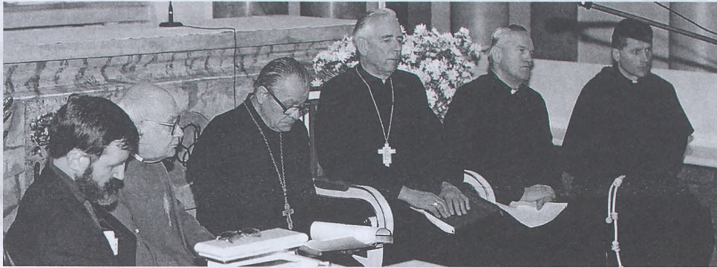
Nabożeństwo ekumeniczne w kościele SS. Norbertanek

(29 VI 1999 - homilia z Mszy św. w uroczystość Świętych Apostołów Piotra i Pawła w Rzymie)