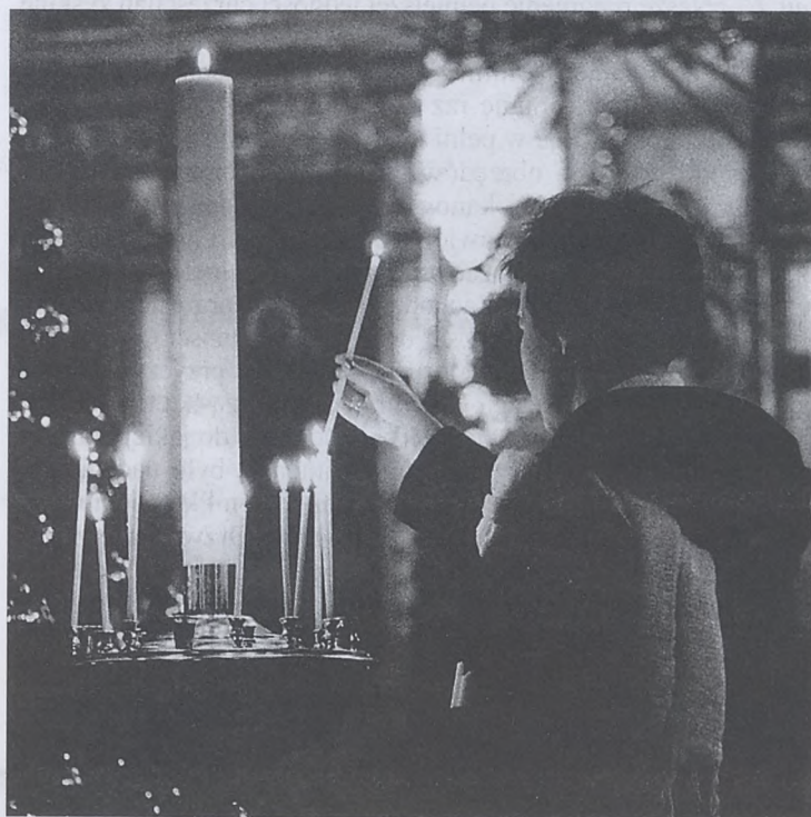
Zapalanie świecy - cerkiew prawosławna