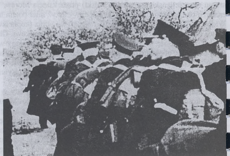
Wrzesień 1939. Polscy policjanci w drodze na wschód

TYGODNIK SALWATORSKI – Redakcja: Piotr Boroń (nac.) tel. 422-68-92, e-mail: tygsal@polbox.com, ks. Stanisław Radoń (asyst. kościelny), Łukasz Strutyński, Bogumiła Szewczyk, Piotr Tumidajski, Jarosław Dzidek, Grzegorz Michaldo, Daniel Rojewski, Piotr Śliwiński Strona internetowa: www.icm.com.pl/salwator/ts (przygotowuje Roman Topór-Mądry). Druk: Pracownia AA – Plac na Groblach 5.