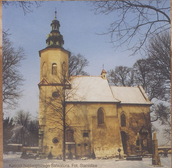
Kościół Najświętszego Salwatora.