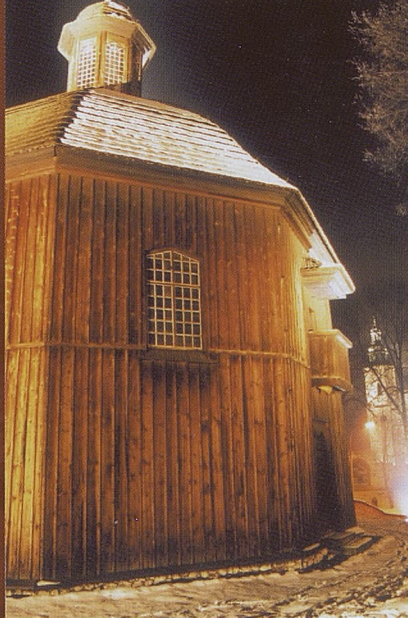
Kaplica Św. Małgorzaty.