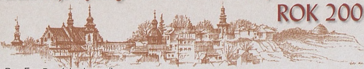
Rys. Ewa Barańska-Jamrozik