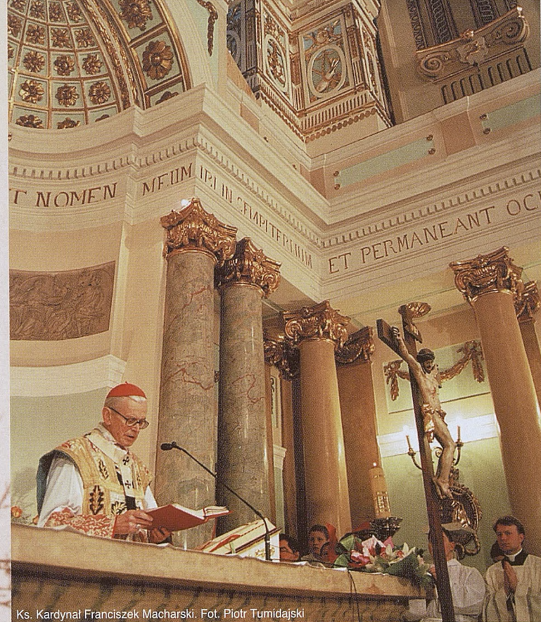
Ks. Kardynał Franciszek Macharski.