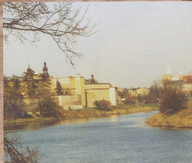
Klasztor Sióstr Norbertanek na Zwierzyńcu i Wawel.