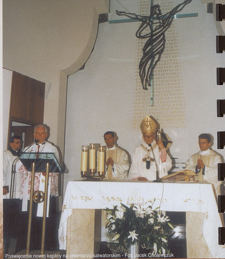
Poświęcenie nowej kaplicy na omentarzu salwatorskim