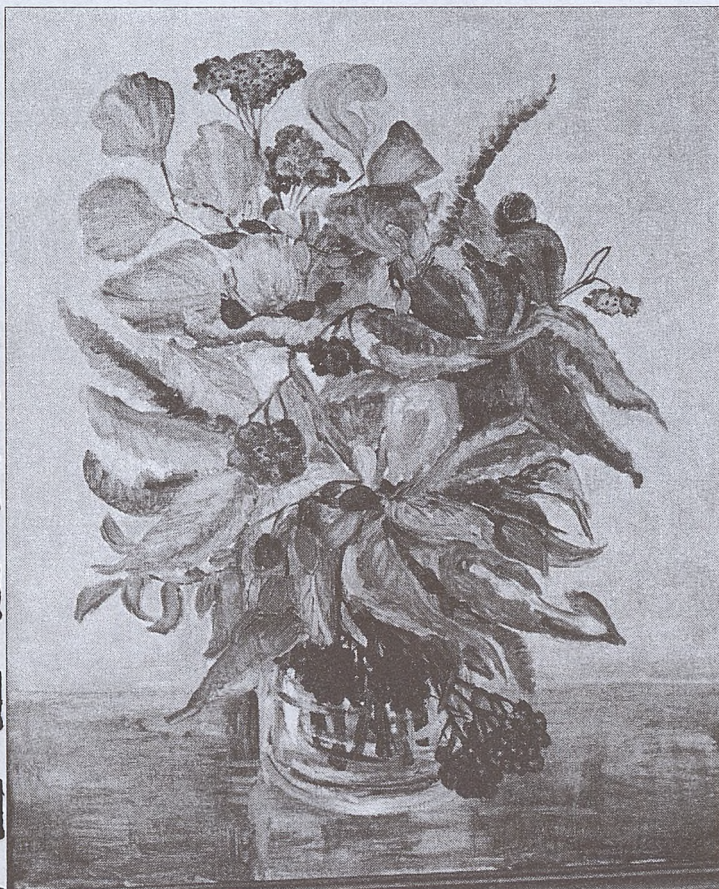
MAL. E. ŚWIEŻY-KLIMECKA (2)