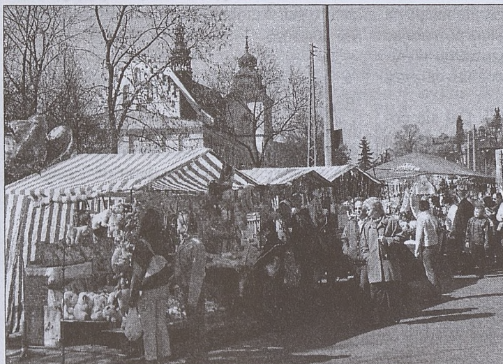
STANISŁAW MALIK STANISŁAW MALIK