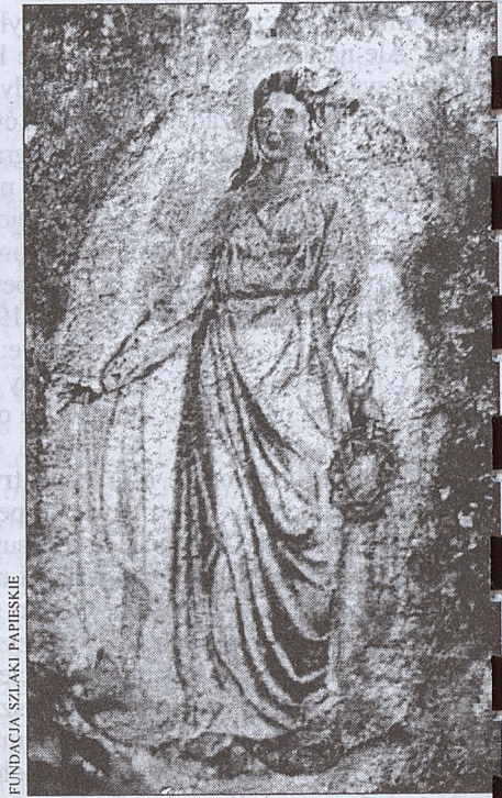
FUNDACJA SZLAKI PAPIESKIE