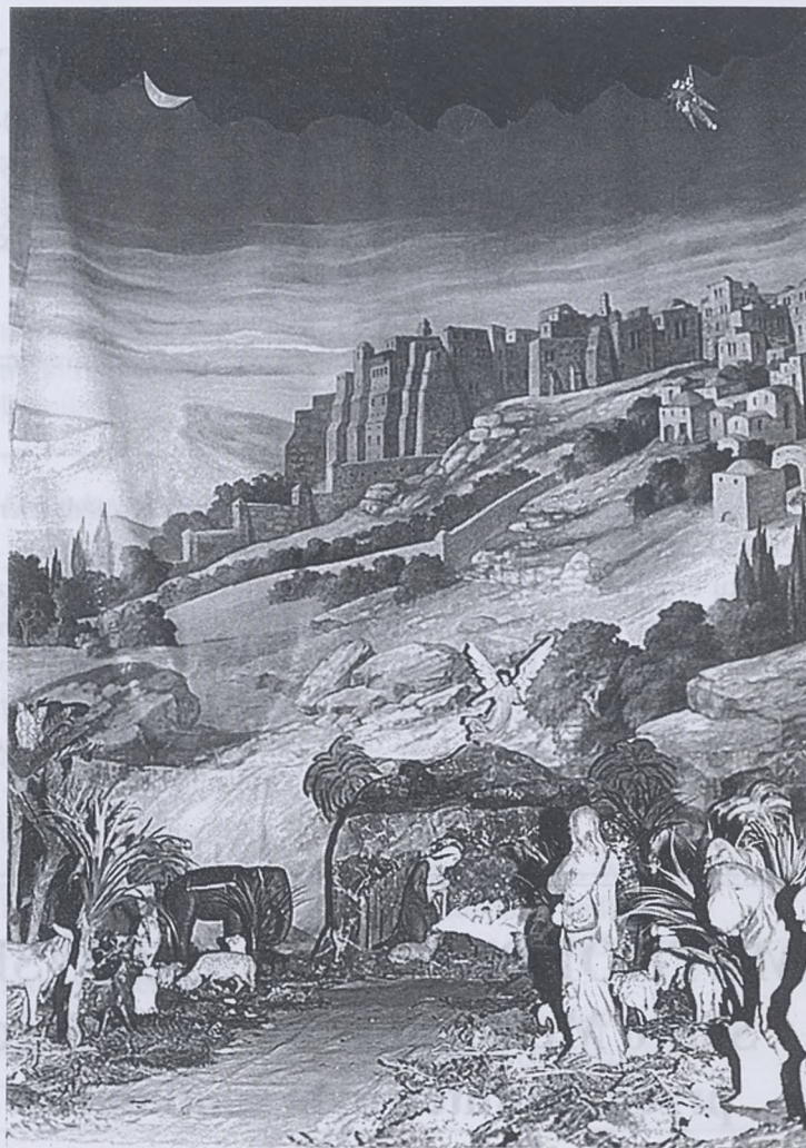
Szopka OO. Bernardynów.