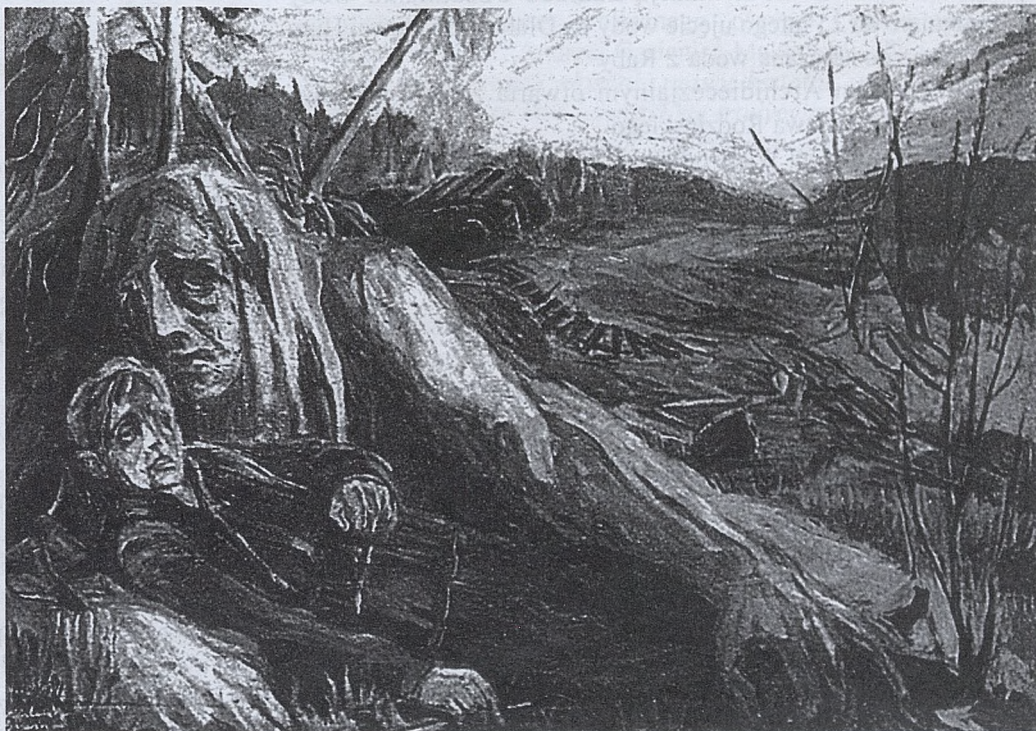
Z polptyku „Póki my żyjemy”, cz. IV, Wrzosa, olej 1974 r.