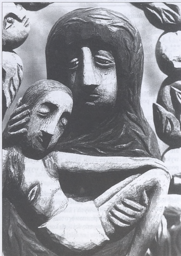
Rzeźba i fot. J. Malik