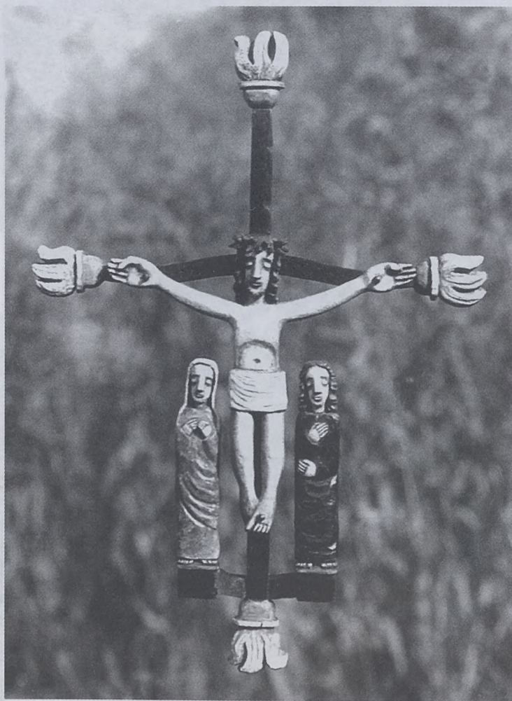
Rzeźba i fot. Jan Malik