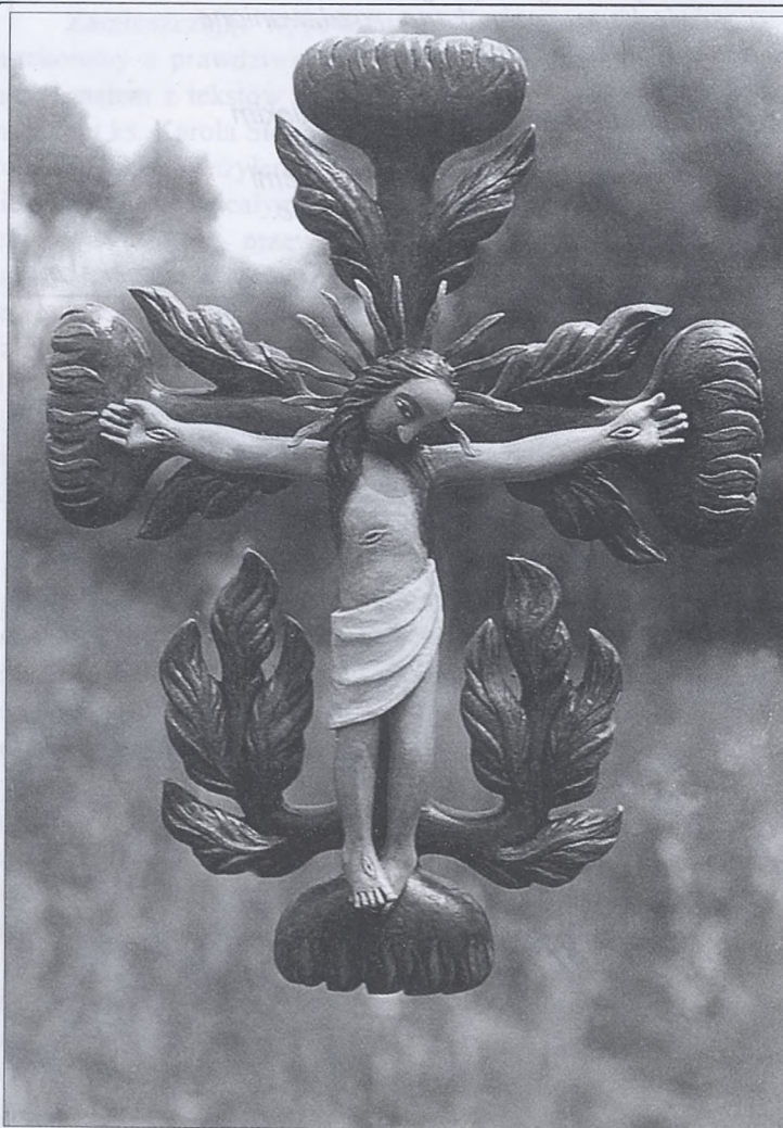
Rzeźba i fot. J. Malik

Ks. Piotr Iwanek Duszpasterz Akademicki Krakowa