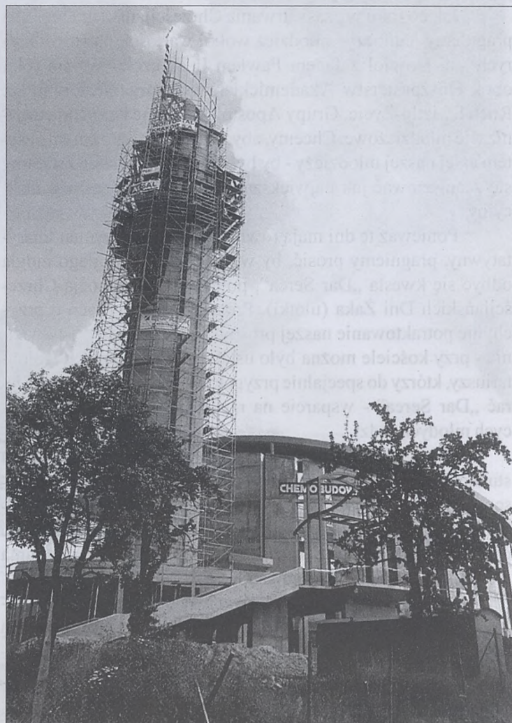
Budowa Sanktuarium Bożego Miłosierdzia w Łagiewnikach

O planowanej pielgrzymce mówiono nieoficjalnie już kilka tygodni temu, po tym jak rzymska gazeta podała, że w tym roku papież może odwiedzić ponownie Polskę. W ostatnich dniach zaproszenie do przyjazdu wysłał Ojcu Świętemu Episkopat Polski, a w czwartek w imieniu władz państwowych - prezydent Aleksander Kwaśniewski.