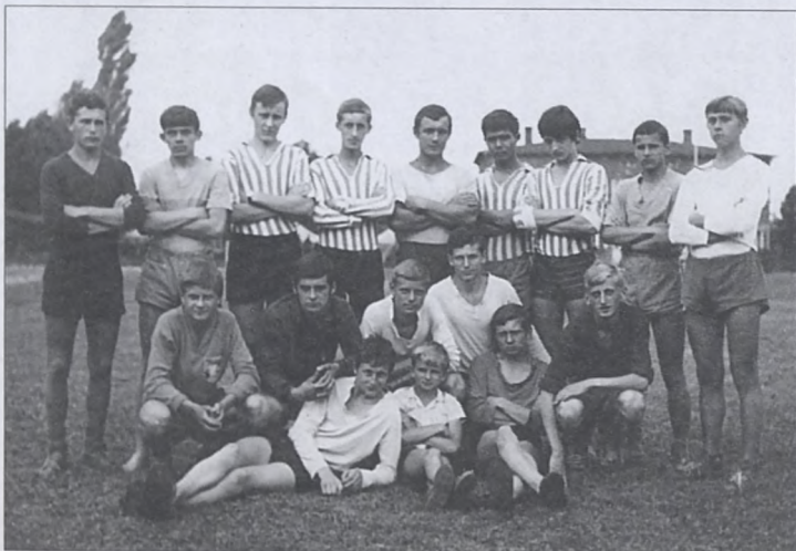
Wspólne zdjęcie juniorów Cracovii i Wisły

Warto dodać, że błyskawicznej karierze tego młodego wówczas piłkarza pomógł przypadek. Otóż poważnie kontuzjo-