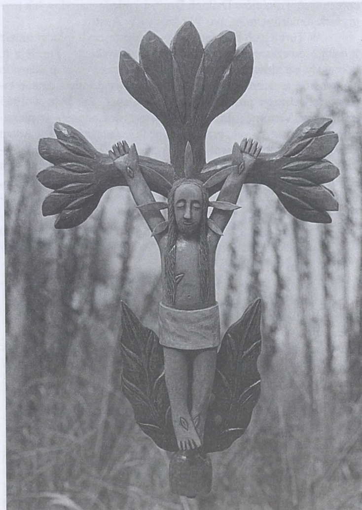
Rzeźba i fotografia - St. Malik