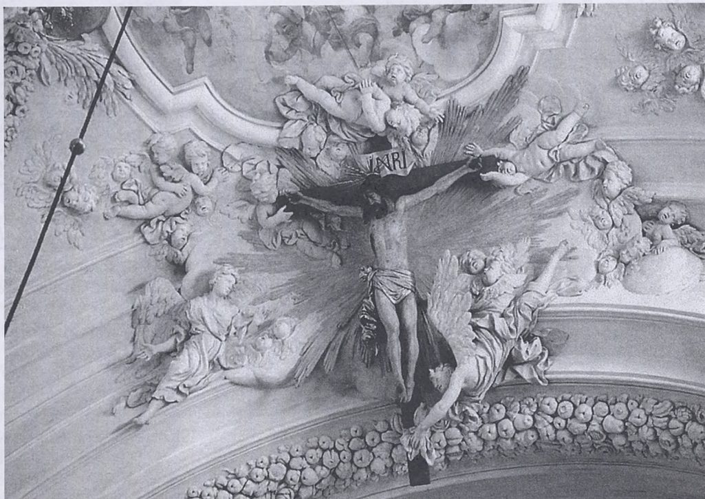
Krzyż na sklepieniu nawy głównej w kolegiacie św. Anny

Dawniej w Niedzielę, zwaną też Kwietniową, inscenizowano triumfalny wjazd Jezusa do Jerozolimy. W Krakowie trasę od kościoła św. Wojciecha do kościoła Mariackiego przemierzała procesja z palmami na wzór rzymskiej ustanowionej w IX w. Obrzęd polegał albo na procesjonalnym obchodzeniu kościoła wewnątrz lub na zewnątrz, albo — w mieście — na przejściu z jednego kościoła, symbolizującego Górę Oliwną, do drugiego kościoła, który wyobrażał Świąte Miasto. Głównym aktorem spektaklu była figura Pana Jezusa na osiołku umieszczona na wózku. Platformę z Chrystusem na osiołku ciągnęli rajcy miejscy, dzieci zaś rzucały kwiaty i palemki przed nadjeżdżającą figurą i wołały: „Hosanna na wysokościach”. Za figurą uczniowie szkół parafialnych i kolegów recytowali wierszowane opowieści o wjeździe Chrystusa do Jerozolimy i Jego przyszłej męce, a po nich rymowanki o poście, śledziu, kołaczach wielkanocnych i o szkolnych kłopotach. Następnie czynili to starsi, przebrani za pielgrzymów, handlarzy wonnościami i żołnierzy. Pojawienie się