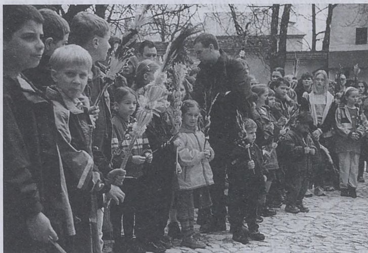
fol. P. Tumidajski

Jak co roku zapraszamy wszystkich na procesję z palmami wokół naszego kościoła. Liturgia, podczas której święcone będą palmy, rozpocznie się na dziedzińcu klasztornym o godz. 10.30 (o ile nie będzie padać). Następnie procesja przejdzie do kościoła, gdzie zostanie odprawiona Msza św. Zapraszamy wszystkich, aby wzięli udział w liturgii Niedzieli Palmowej, zwaną przez niektórych Niedzielą Kwietniową.