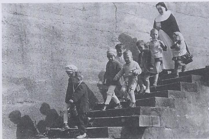
W grupie przedszkolaków z Siostrą Norbertanką (rok 1960)

Kraków, moje Miasto... Jeśli pojawia się czasem (nieczęsto) w moich wierszach, to zawsze pisane "z dużej litery": po prostu Miasto. I każdy wie, że nie o inny gród może tu chodzić. Osobiście mój krakowianizm odczuwam jak ciężący na mnie wyrok dożywocia - ja jestem skazany na to miasto. Wielokrotnie w tamtym ponurym okresie przed rokiem 1990 miałem okazję zostać na tzw. zachodzie, dokąd "za chlebem" wyjeżdżałem. Dziewięciokrotnie - powracałem tutaj, za druty i zasięki ówczesnego systemu... Bo tu była ukochana kobieta, tu był mój mały syn. I było jeszcze coś, czego nigdy - w odróżnieniu od mojej rodziny - nie mógłbym nigdzie z sobą zabrać,