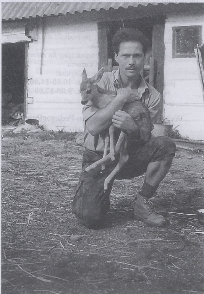
Poeta w Bieszczadach (rok 1999)

AJ: To znaczy umieć przenieść do niszy literackiej całą swą wiedzę o naturze i doświadczenie z własnego zaangażowania w walkę o ochronę przyrody, o przetrwanie jej nienaruszonych jeszcze enklaw. To znaczy nie zużywać papieru na pocztówkowe opisy piękna