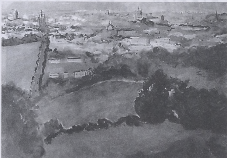
Panorama Krakowa, olej. Adam Pochopień