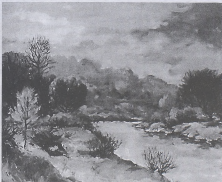
Stare koryto Wisły, olej