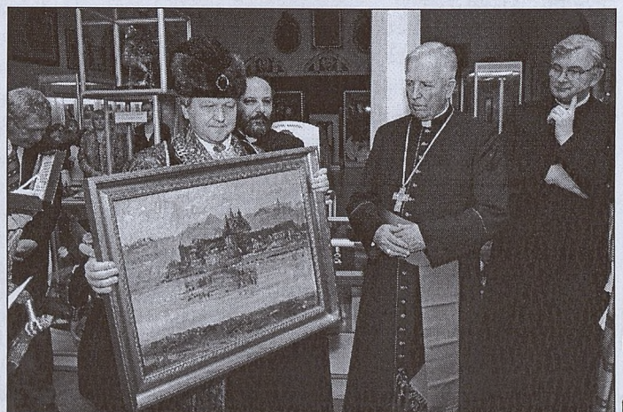
Bractwo przekazało również w darze obraz przedstawiający klasztor Sióstr Norbertanek.