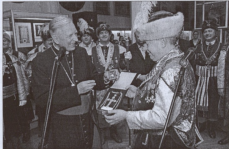
Ks. Infulat przekazał dla Muzeum Historycznego Miasta Krakowa pektorał i pierścień od Ojca Świętego.