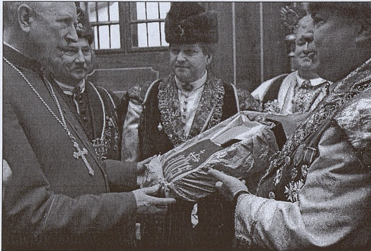
Przed Mszą św. Bracia Kurkowi przekazali w darze złoty ornat, w którym Ks. Infułat celebrował Mszę św.

Na ręce Księdza Infułata spłynęły liczne gratulacje i życzenia od różnych środowisk i osób, z których kilka drukujemy poniżej. Jako Redakcja „Tygodnika Salwatorskiego” również składamy najserdeczniejsze gratulacje Jubilatowi, który jest nam szczególnie bliski.