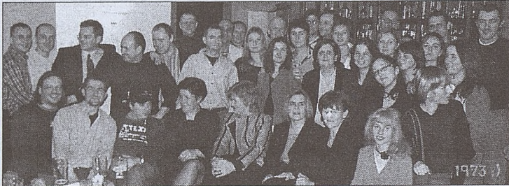
Spotkanie 22 stycznia 2005.