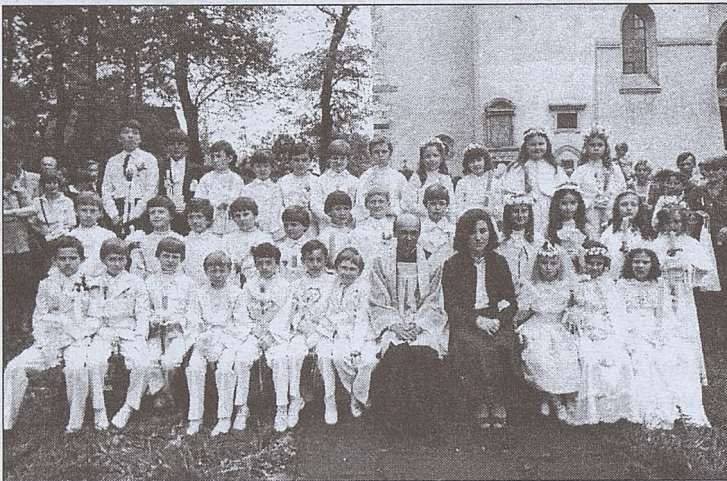
I Komunia Święta, maj 1982, Salwator

Przed wejściem do Kawiarni każdy odczuwał lekką treść. Wiele razy przez głowę przebiegła myśl: „Czy nie zawrócić?”, „Jak przy-