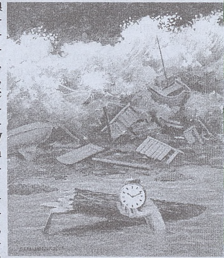
26 XII 2004 tempera 75 x 60 cm

Zachęcamy do częstego odwiedzania naszej strony internetowej http://tygodniksalwatorski.icm.com.pl . Podczas wizytacji biskupiej w naszej parafii codziennie późnym wieczorem będzie można obejrzeć w galerii fotografie z danego dnia wizytacji.