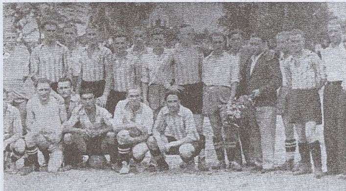
Rok 1942 - drużyna Krakowa i Gołkowa

Działalność sportowa w Krakowie została wznowiona 18 stycznia 1945 r., kiedy to zawodnicy Zwierzynieckiego i Juwenii rozegrali pierwszy mecz w wolnym od Niemców Krakowie. Spotkanie to poprzedzało starcie gigantów: Cracovii i Wisły.