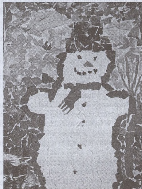
Emilia Panek - 8 lat