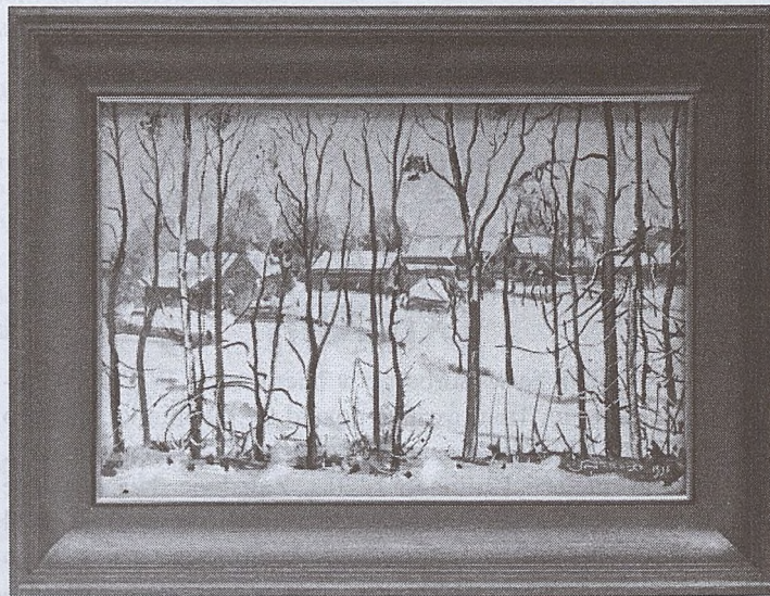
Zima w Majdanie Ruszowskim, mal. Antoni Kawalko

s. Agnieszka Koteja Kalatówki, 3.09.2003