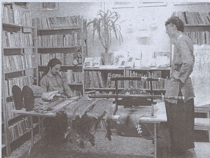
Przygotowanie do prezentacji