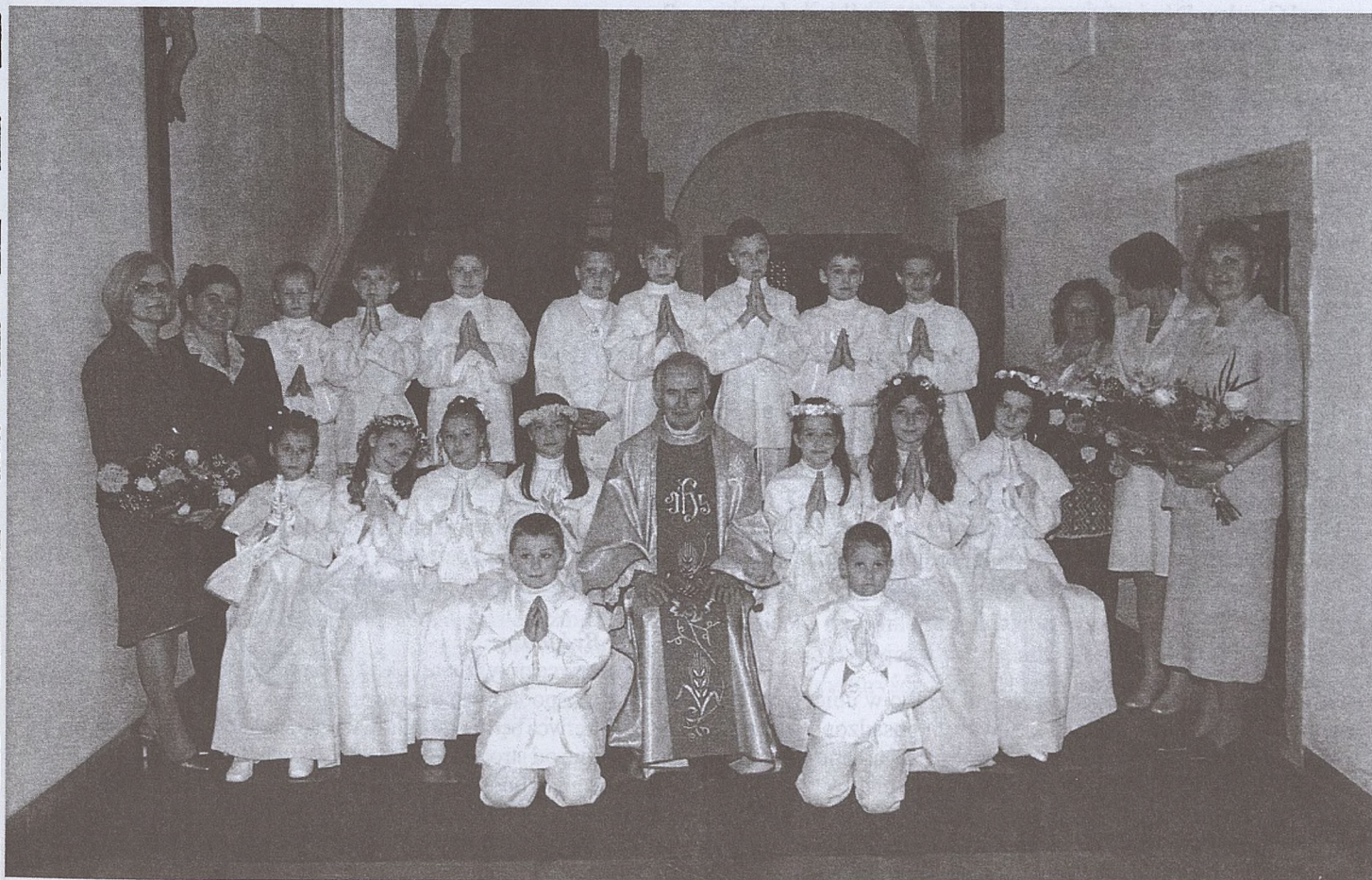
Klasa II d ze Szkoły Podstawowej nr 31 im. dr. Henryka Jordana