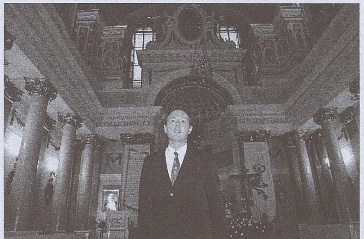
Parafia Najśw. Salwatora w Krakowie