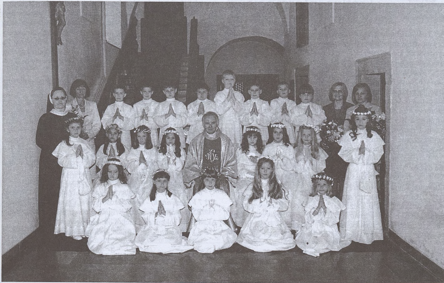
Klasa II c ze Szkoły Podstawowej nr 31 im. dr. Henryka Jordana