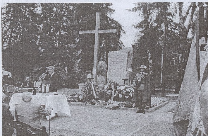
Uroczystości w rocznicę pacyfikacji - rok 2004

Komitet Organizacyjny Ku Czcii Pomordowanych przez Niemców na Woli Justowskiej zaprasza na tegoroczne obchody