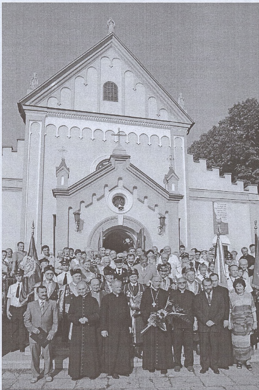
Wspólne pamiątkowe zdjęcie uczestników uroczystości pod kościołem parafialnym.