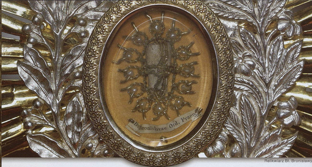
Relikwiarz Bł. Bronisławy