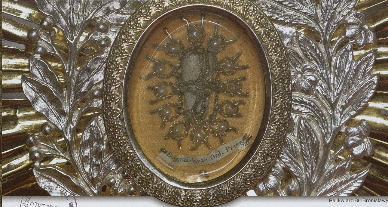
Relikwiarz Bł. Bronisławy