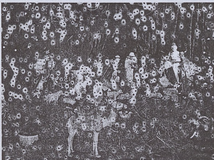
Szopka u OO. Bonifratrów

W Polsce przedłużamy ten czas o trzy tygodnie, ale i on się kończy. To już ostatnie spojrzenie na szopki. Ostatni tydzień, kiedy zwyczajowo śpiewamy kolędy, trzymamy w domu choinki. Na prawie rok chowamy lampki, bombki, łańcuchy. I dobrze. Byle tylko razem z nimi nie zapakować, nie schować Jezusa. Boże Narodzenie to dopiero początek Jego misji. Nadejdą trudne dni krzyża. Taka kolej ziemskiego życia. Ale po nim przyjdzie zmartwychwstanie. Dla wszystkich, którzy Jezusowi będą towarzyszyć w dalszej drodze.