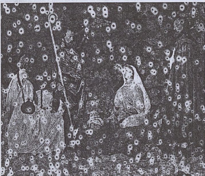
Szopka u OO. Dominikanów