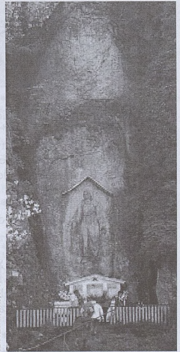
ANDRZEJ WASKO, SDS