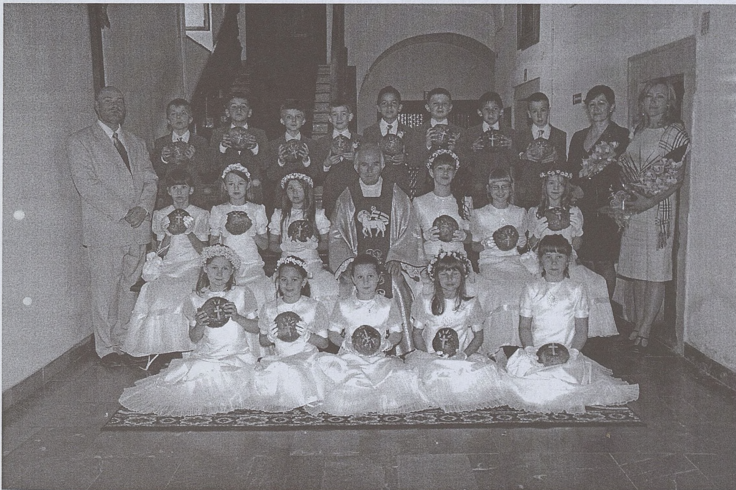
Zespół szkół społecznych nr 6, fot. Stanisław Malik