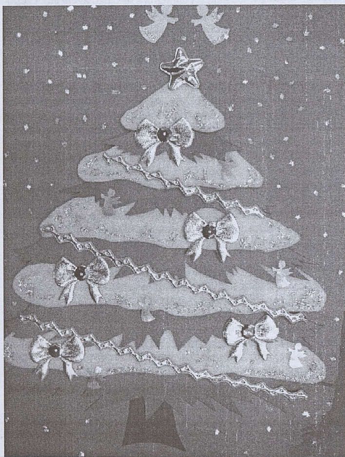
Wykonanie: T. Michniak