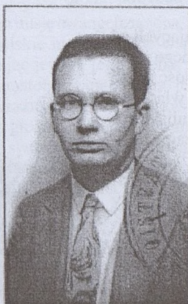
Prokurator Andrzej Łada-Bieńkowski