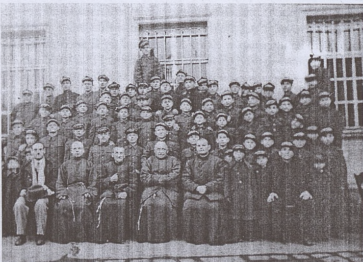
Chłopcy z zakładu na ul. Kosciuszki 86. Rok 1935.

Wychodząc naprzeciw prośbom naszych mieszkańców, zorganizowano w roku 1992 Klub Anonimowych Alkoholików w naszym przytulisku. Grupa A.A. jest organizacją samopomocową, skupiającą w swoich szeregach ludzi uzależnionych oraz sympatyków, którzy odnajdują w proponowanych przez Ruch AA formach terapeutycznych również pozytywne dla siebie wzorce odreagowań i skuteczną formą autopsychoterapii w stresowych sytuacjach. Uczestniczenie w spotkaniach Grupy AA oparte jest na zupełnej dobrowolności, odpowiednim poziomie motywacji oraz twórczym działaniu 101 .