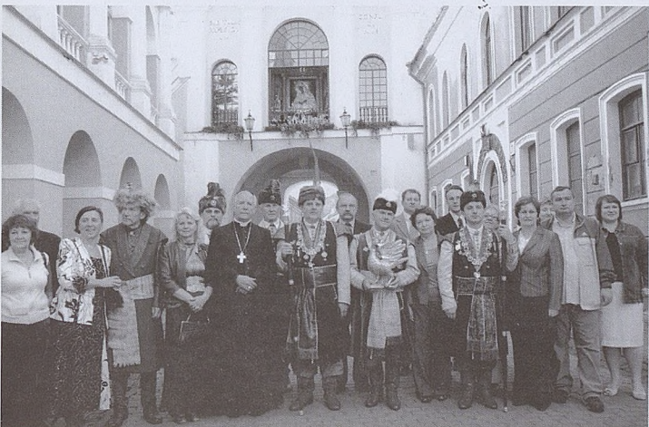
Bractwo Kurkowe w Wilnie - 2008 rok.