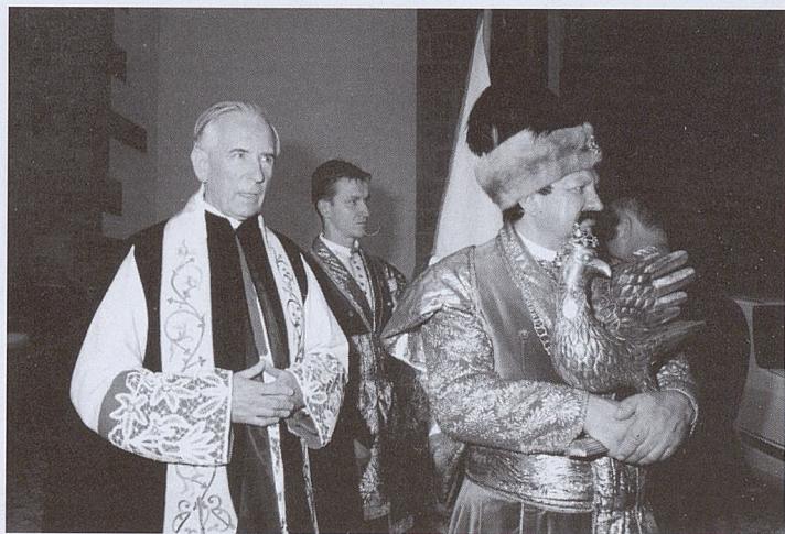
Jubileusz na Salwatorze.