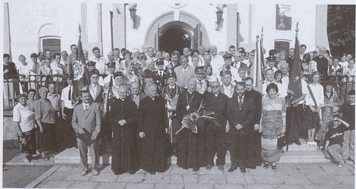
Nadanie Gminnemu Centrum Kultury i Promocji Nowego Brzeska imienia Alicji i Franciszka Bryłów - 20 lipca 2007 r.