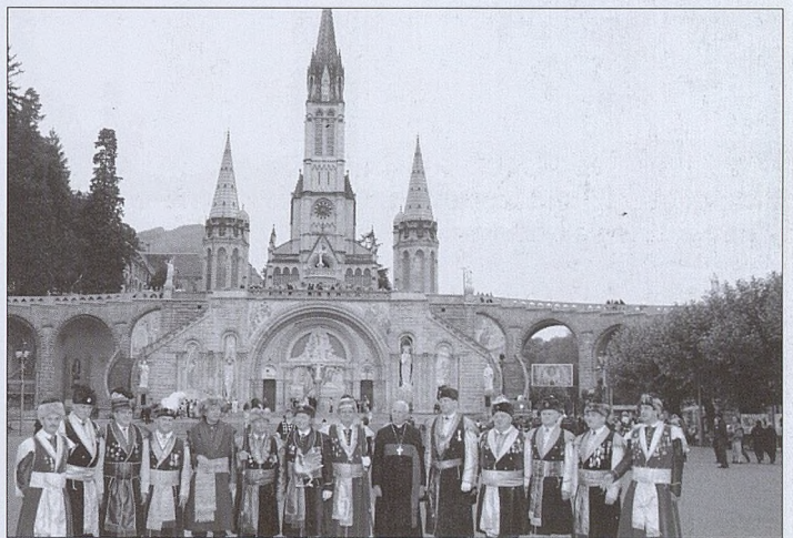
Pielgrzymka do Lourdes.