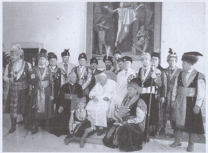
Podczas jednej z audiencji u Ojca Świętego Jana Pawła II.