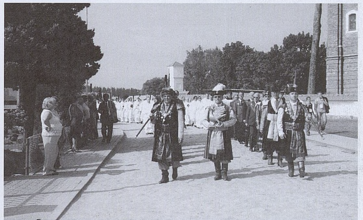
Bracia w Wilnie.