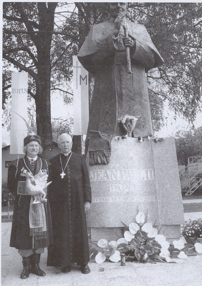
Pomnik Ojca Świętego w Lourdes.