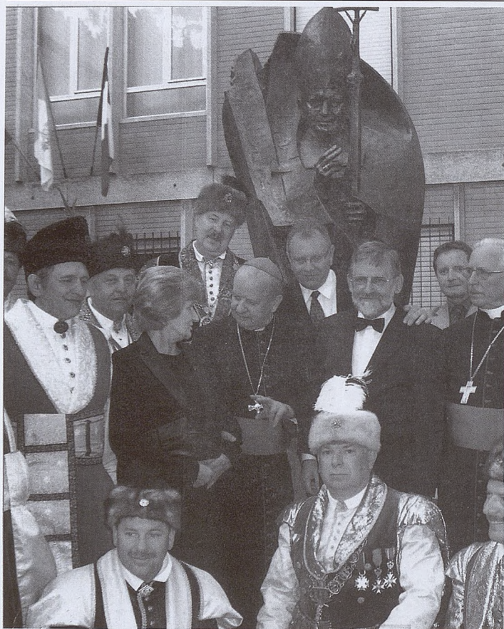
Odsłonięcie pomnika Jana Pawła II w Rzymie - 18 V 2004 r.