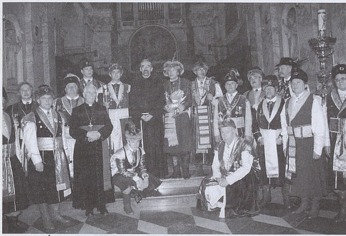
Ziemia Święta - rok 2006.