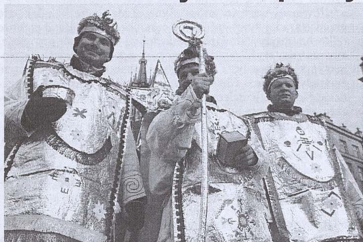
Fot. Piotr Tumidajski

To jakże piękne święto obchodzone jest przez Kościół katolicki corocznie 6 stycznia i nazywane jest także Świętem Objawienia Pańskiego, jako że za pośrednictwem Trzech Króli (Mędrców) właśnie wtedy Zbawiciel dał się poznać całemu światu – również światu nieżydowskiemu. W ikonografii chrześcijańskiej nieprzerwanie od XIV wieku jeden z Mędrców jest przedstawiany jako czarnoskóry, co podkreśla uniwersalność objawienia. Kościół prawosławny (podobnie jak katolicki) uznaje Trzech Króli za świętych i według swojego kalendarza obchodzi święto Objawienia (Epifanii) dnia 19 stycznia.