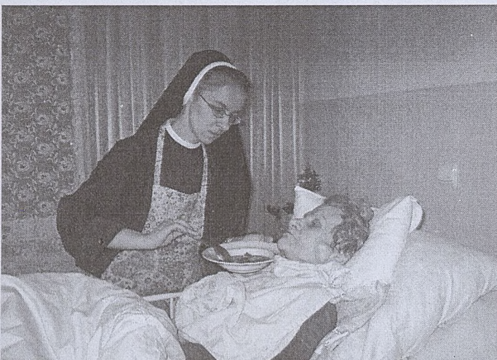
Posługa Sióstr Serafitek wśród najbardziej potrzebujących