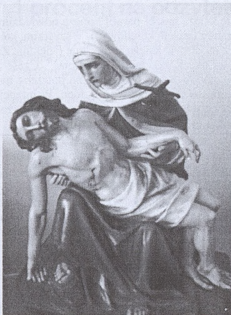
Matka Boża Bolesna – Patronka Zgromadzenia Córek Matki Bożej Bolesnej (Siostr Serafitek)