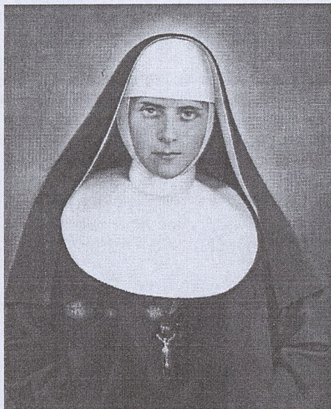
Bł. S. Sancja Janina Szymkowiak