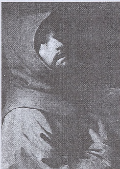
Św. Franciszek z Asyżu

8 czerwca otrzymałem 18 jednokilogramowych paczek z Węgier i Czechosłowacji. Niestety, dokładnie połowa paczek została okradziona: do środka włożono stare buty, brudne szmaty, przestarzałe lekarstwa. Nie wyjęto kartek z zawartością paczki, więc wiem, że straciłem około 80 dolarów. Myślałem nawet prosić Ofiarodawców o zaprzestanie przysyłania mi darów, bo nie chcę pomagać złodziejom: ja bez tych darów obejdę się. Dary do dzieci nie docierają. Jednakże obecne na misji Siostry Urszulanki (dwie Włoszki) zaofiarowały się odbierać każdą zaadresowaną na mnie przesyłkę już w Tamatawie, w urzędzie przy porcie. Mamy nadzieję, że teraz straty nie będą duże.