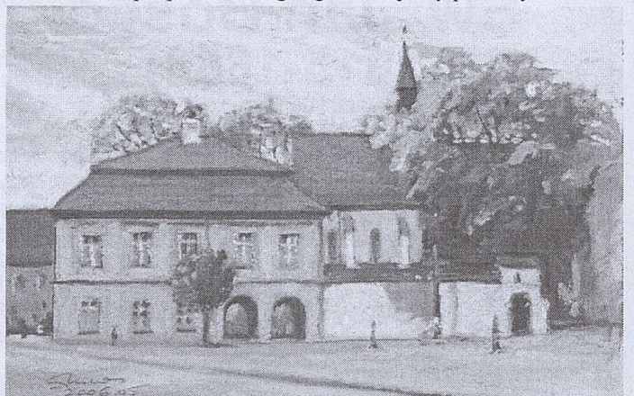
Jerzy Pulchny, Dom Długosza

Obrazy Jerzego Pulchnego można oglądać także w internecie na stronie http://picasaweb.google.com/jerzy.pulchny/