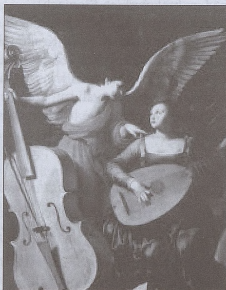
Św. Cecylia i Anioł - mal. Carlo Saraceni