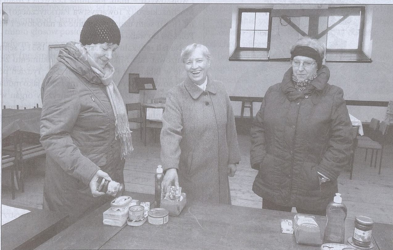
fol. S. Malik