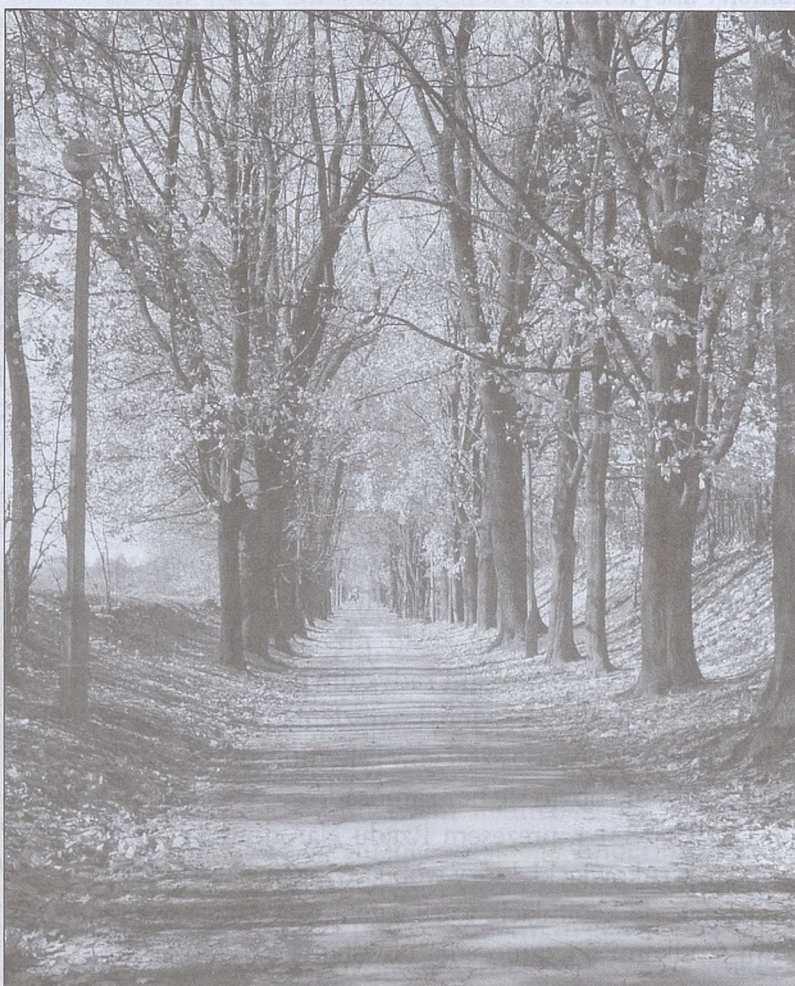
fol. B. Puchata