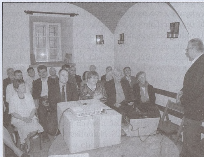
Spotkanie DRP – 20.05.2012 r.