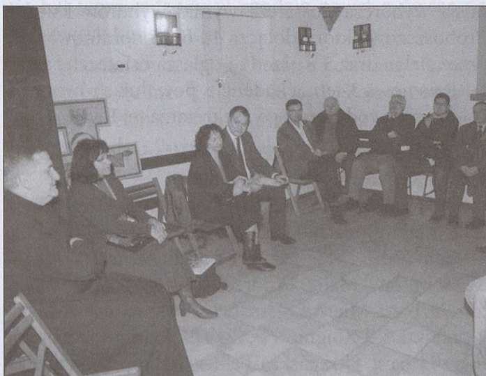
Spotkanie DRP – 18.11.2012 r.